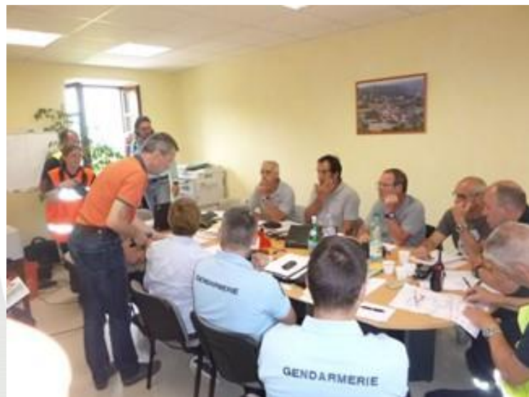
Ici en 2015 au PC d'Ordonnaz, lors de l'exercice secours régional à la grotte de la falconnette dans l'Ain il explique le rôle du SSF au directeur de cabinet et à madame la sous-préfète de Belley