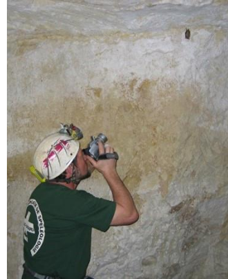
Photo extraite du PPT Regards sur les chauves-souris (CD oct 2005)

Il venait aussi régulièrement dans l'Ain, pour les comptages de chauve-souris. Lors du stage CDS de 2005, il nous présente ses deux présentations powerpoint qui font toujours références : « des Clés de détermination des chauves-souris au cours de l'hibernation », et « Chauves-souris – regards sur leur vie ».