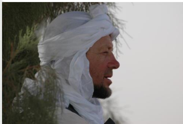
Voyage en Jordanie en 2012

J'ai apprécié écouter les nombreuses anecdotes qu'il avait accumulé au fil de son expérience.