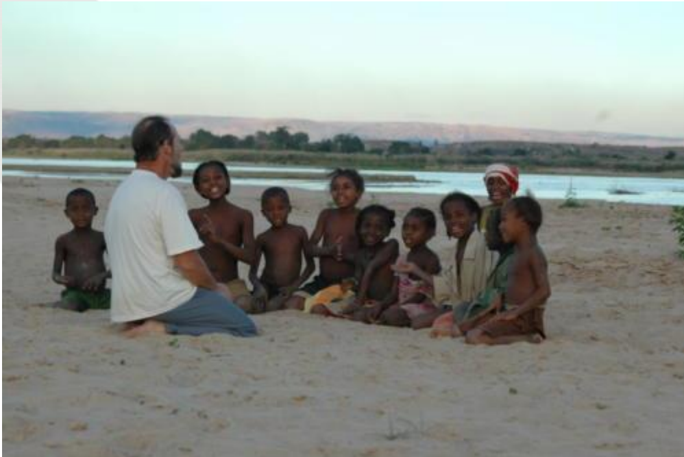
Voyage à Madagascar en 2010

Merci Christian pour toutes ces belles leçons de vie Avec Frach', Pierrot et Benjamin tu as été une de mes plus solides références. Tu es encore capable de faire descendre le Paradis dans les entrailles de la Terre !