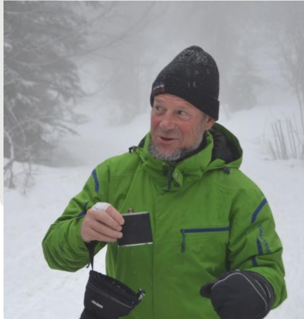
Dans les Bauges en 2015