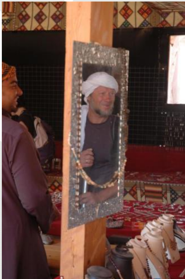
Voyage en Jordanie en 2012