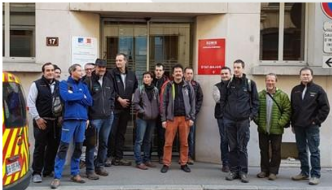
Le 11 Mars 2017, il fait partie d'une délégation du SSF « Rhône Alpes » au COZ de Lyon

Le 11 mars 2017, il était encore avec nous lors de la rencontre des CTDS AuRA au COZ et quelques mois plus tard sur le congrès d'Hauteville, pour l'expérimentation de retransmission de vidéo souterraine des manips de civière.