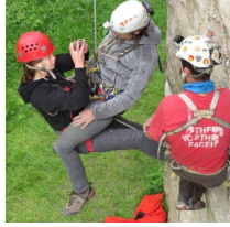
Bilan de la journée technique autour de l'auto-secours du 30 avril