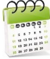
Calendrier des formations