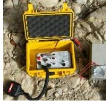
Formation régionale transmission du 23 -24 juillet au Jean Bernard (74)