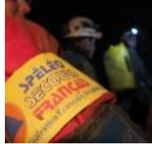
Barnum SSF 69/74 du 24-25 sept à la Poya (74)