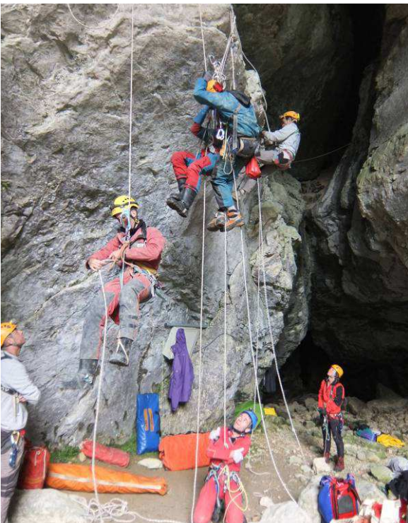
Mise en place et utilisation du système de balancier