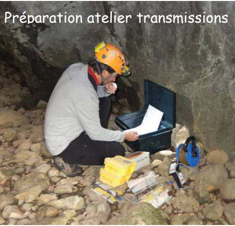
Préparation atelier transmissions