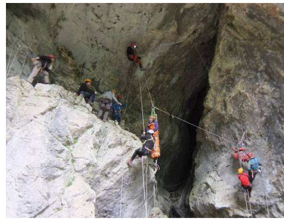
Chaque équipier s'affaire à son poste