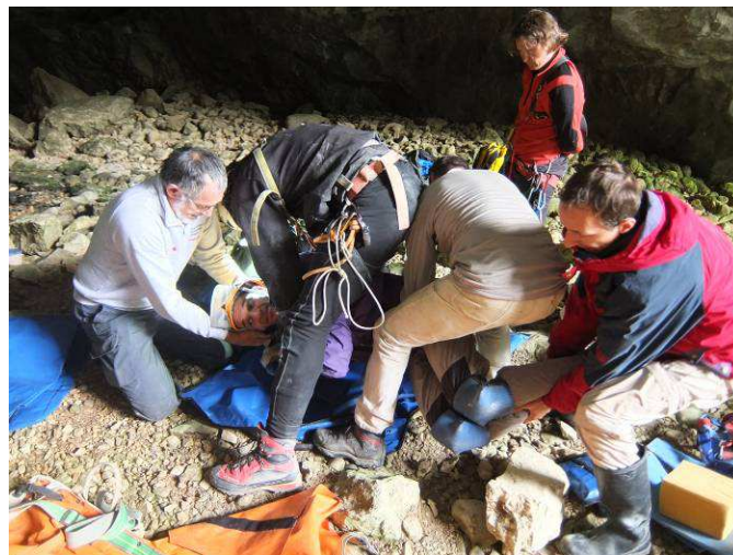
Manipulation de la victime selon les recommandations du médecin