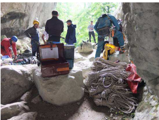
Préparation des équipiers et du matériel, sous l'œil attentif des CTs