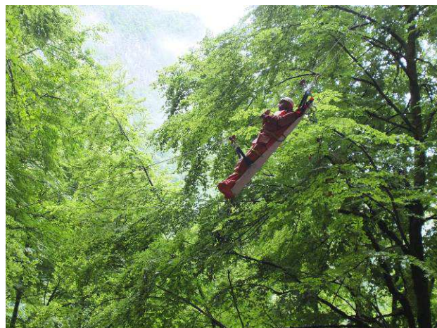
Tyrolienne horizontale et tyrolienne oblique