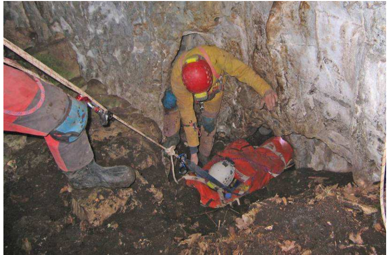
Sortie de la civière d'une étroite chatière