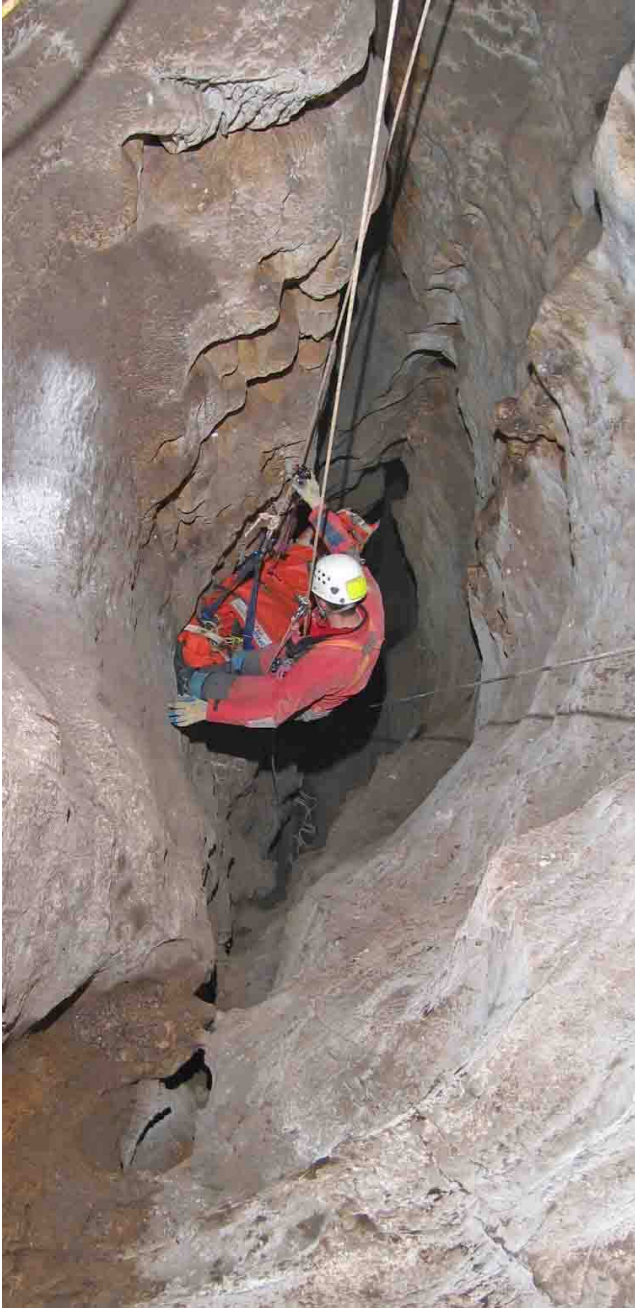
Remontée de la civière en position horizontale pour le confort de la victime